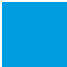
Quadratbanner 150 x 150 Pixel bis zu 100 KB